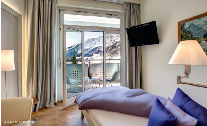
高级单人房 (含医疗床)