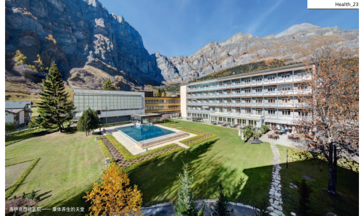
洛伊克巴德医院——康体养生的天空